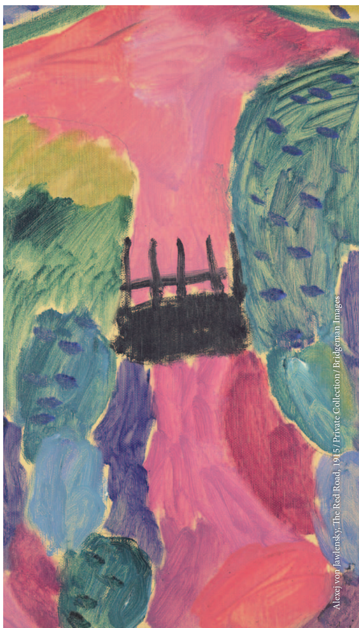
Alexej von Jawlensky, 'The Red Road', 1915 / Private Collection / Bridgeman Images

Der Psychologe Dieter Rohmann hat auf der Grundlage seiner langjährigen Erfahrungen in der Beratung bei Weltanschauungsfragen ein Drei-Stufen-Modell der Ausstiegsberatung entwickelt (siehe Abbildung). An der »Spitze des Eisbergs« treten zunächst die Glaubenspraktiken und Lehren der Gruppe in Erscheinung. Erst später können die psychologischen Bindungsmechanismen innerhalb der Gruppe analysiert werden. Eine psychotherapeutische Vorbildung ist nötig, um dann genauer die individuelle »Bedürfnis-Kult-Passung« zu analysieren und Mo-